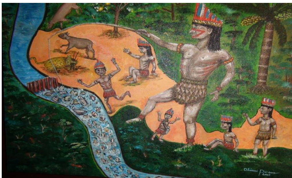
Figura 8: Mito da criação Tikuna