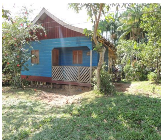
Figura 6. Casa na terra firme na Comun. Indíg. de Filadélfia