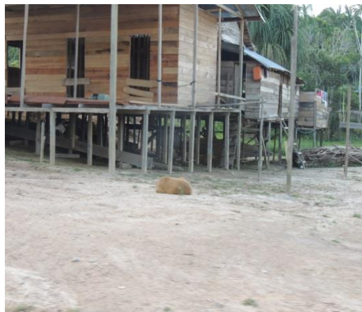
Figura 5. Casa Tikuna na várzea (hoje)

Com o passar dos tempos e por influência das casas dos colonizadores, o modelo de moradia dos Tikuna sofre muitas modificações.