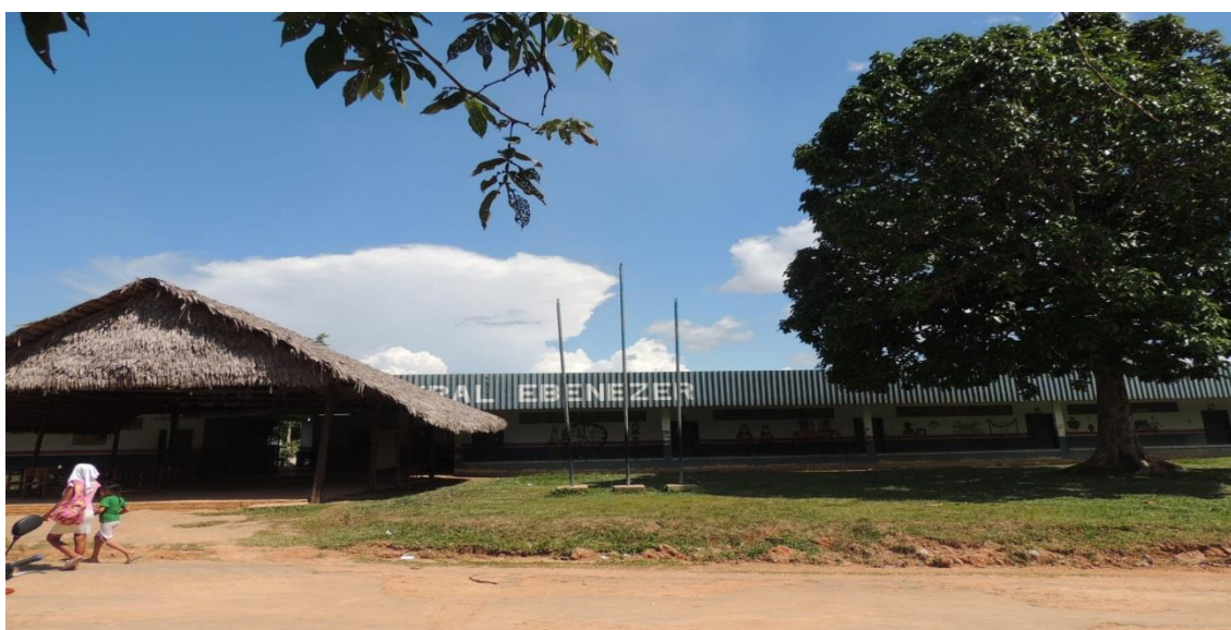
Figura 9. Frente da Escola Municipal Ebenezer.