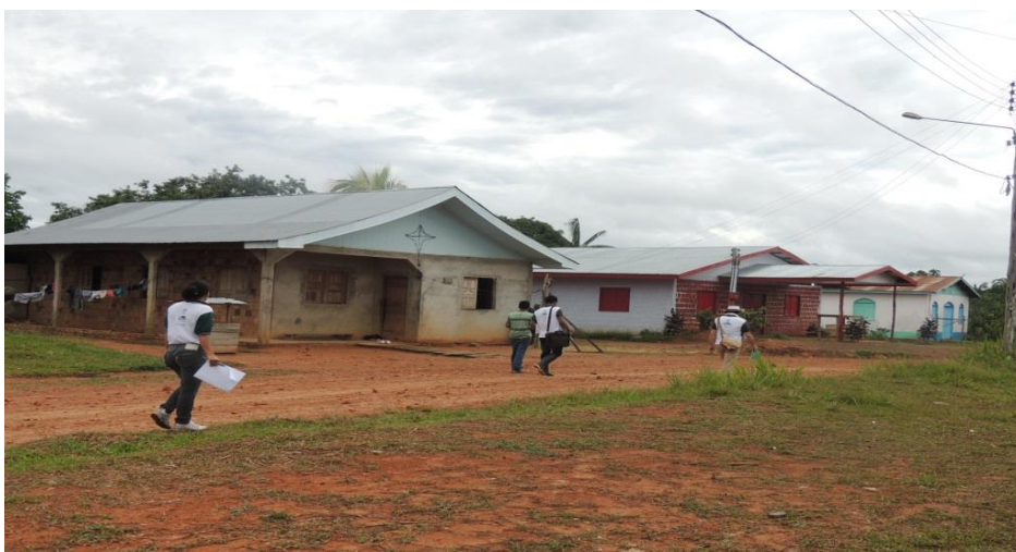
Figura 7. Casas construídas em terra firme, Comunidade Indígena Tikuna.

Fonte: Darcimar Souza Rodrigues – 30/11/2013