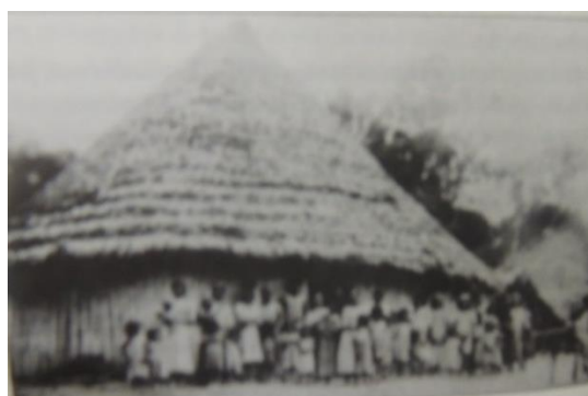
Figura 4. Alto Rio Solimões- maloca de índios Tikuna do Igarapé Belém