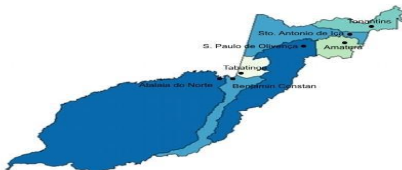
Figura 1: Municípios da região do Alto Solimões, onde se localizam os Tikuna atualmente.